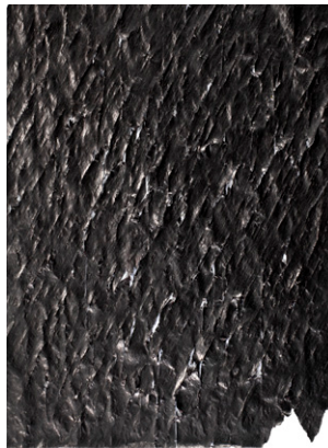
Sans titre , 2013 54 x 40 cm, stylo et mine de plomb sur papier journal, courtoisie Choi Byung-So et Galerie Maria Lund, Paris © Marc-Antoine Bulot