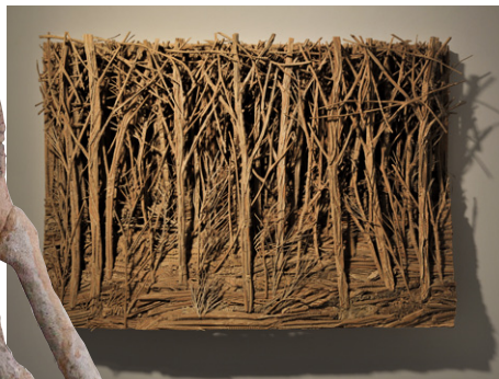
Forêt , 2013 90 x 130 x 17 cm, bois et carton, courtesy Galerie Suzanne Tarasiève, Paris, coll. part. © Olivier Toggwiller